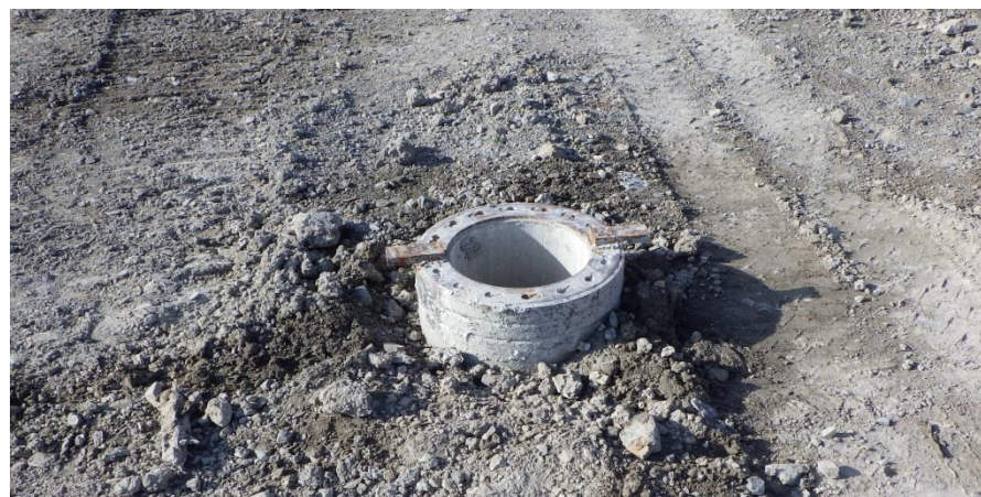
(8) 杭打設 [完了]