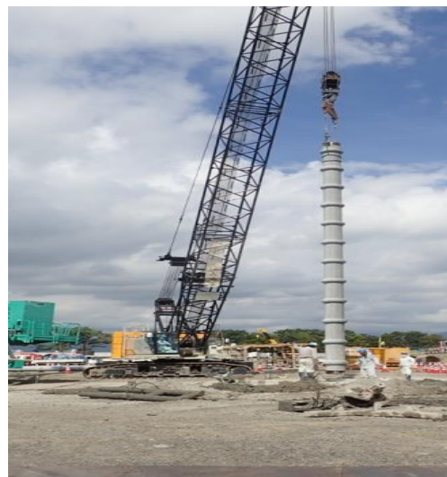
(6) 杭打設 [杭建て込み]

先行ボーリング箇所に、大型クレーンで、杭を入れています。 杭は1ヶ所当たり、4本の杭を繋ぎ、深度は41m。また、杭の直径は、 \phi 450 ～ \phi 1000 です。