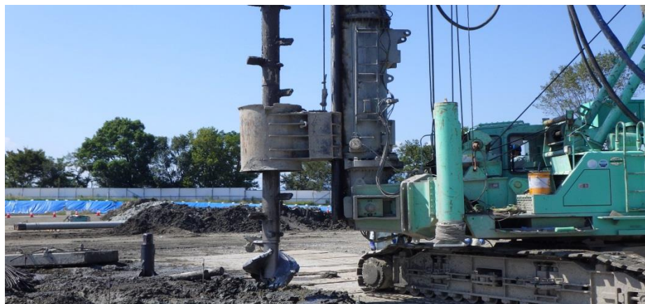
(5) 杭打設 [ボーリング]