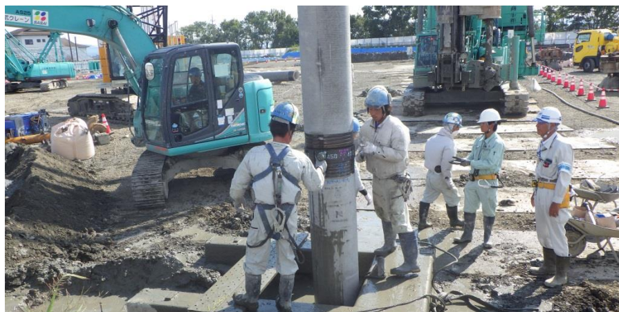
(7) 杭打設 [杭接続]

先行ボーリング箇所に、大型クレーンで、杭を入れています。 杭は1ヶ所当たり、4本の杭を繋ぎ、深度は41m。また、杭の直径は、 \phi 450 ～ \phi 1000 です。