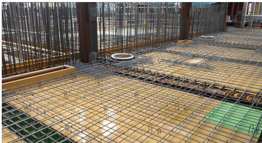
(1) 熱回収施設：ごみピット周囲（2F床）配筋工事