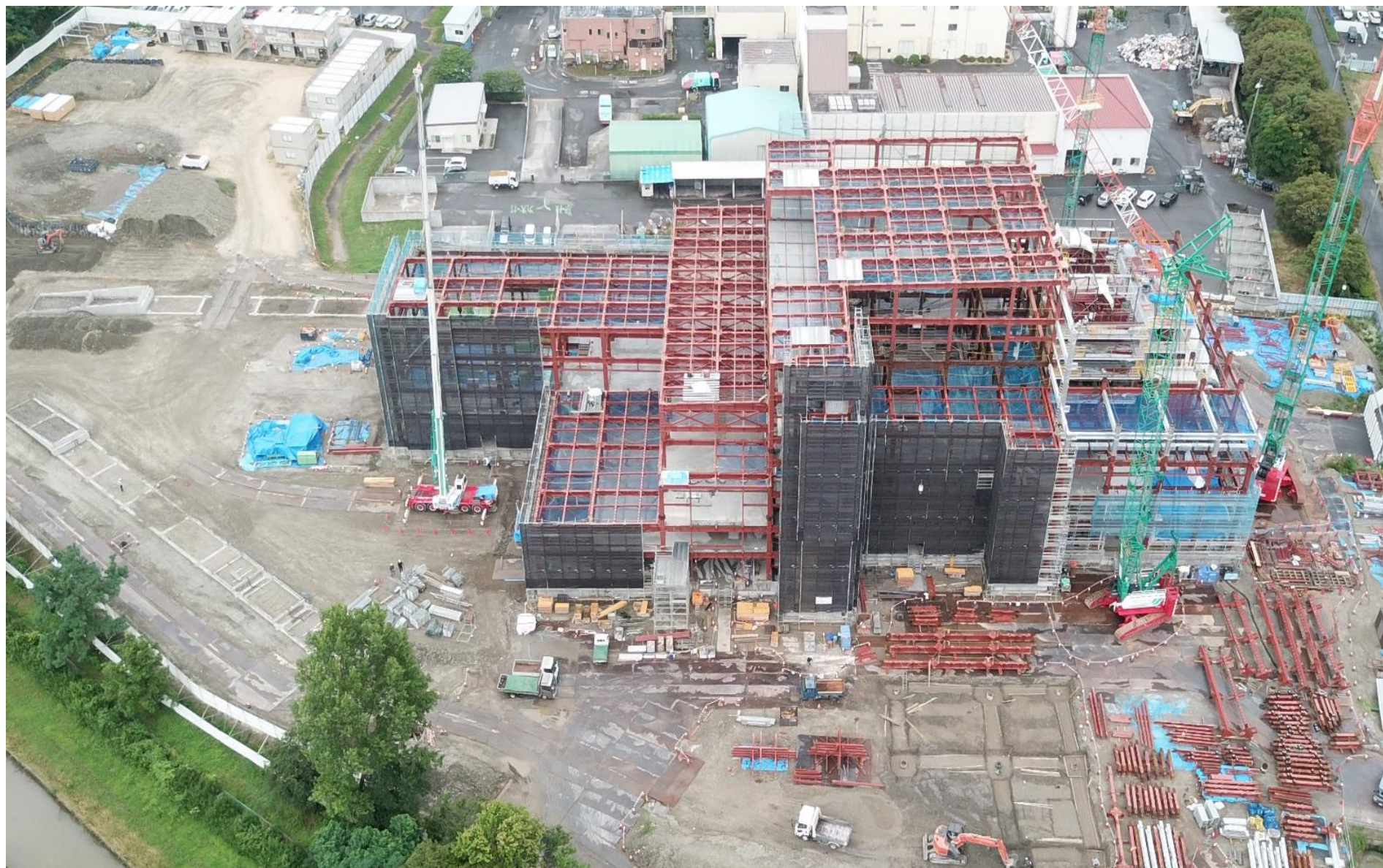
令和2年6月（2020年6月）の工事状況 6月25日撮影