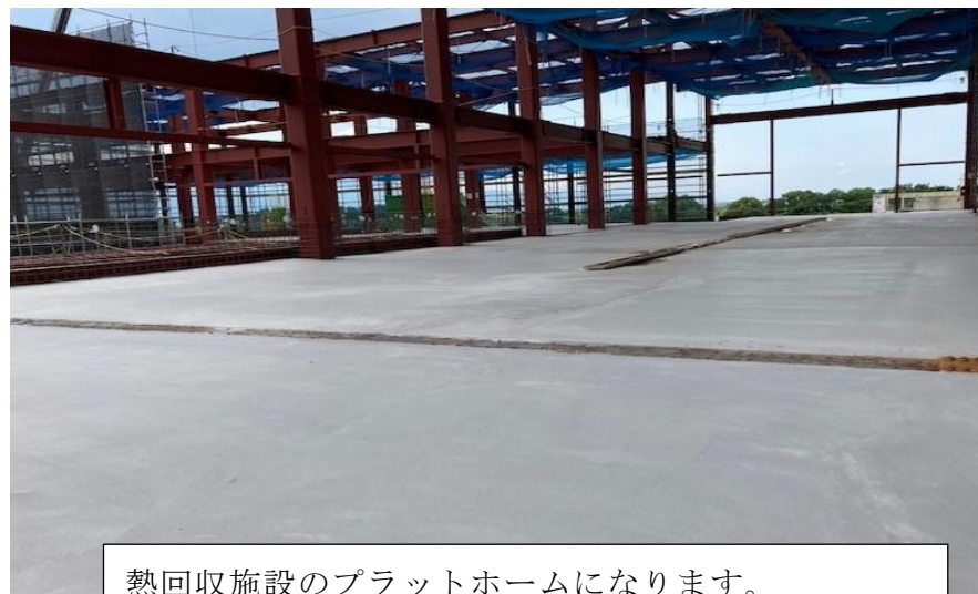
(2) 熱回収施設：プラットホーム（3F）スラブ施工状況