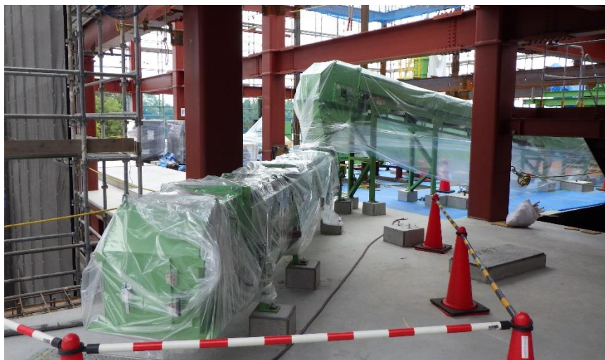
(5) リサイクル施設：アルミ搬送コンベヤ据付