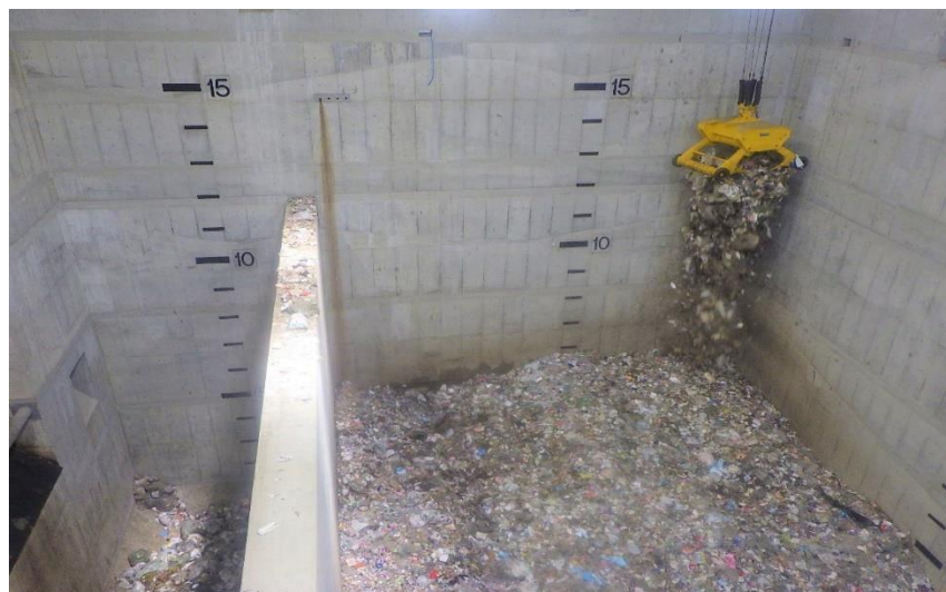
(3) 熱回収施設：ごみ受入れ開始（貯留ピット）