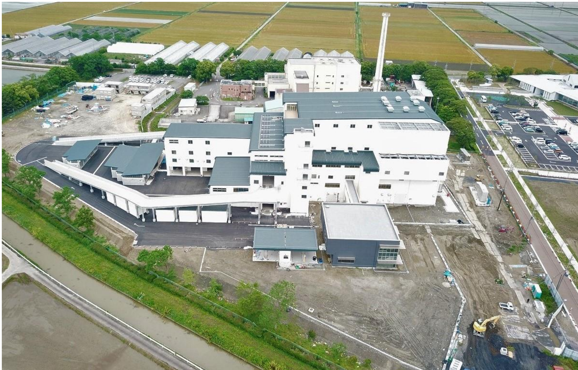
令和3年5月（2021年5月）の工事状況 5月22日撮影