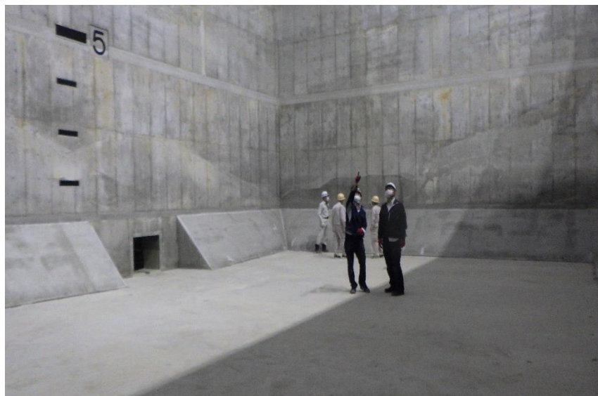
(1) 熱回収施設：ごみピット内の検査