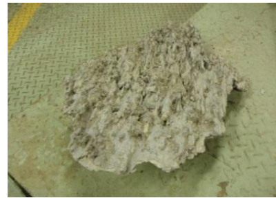
落下したクリンカ