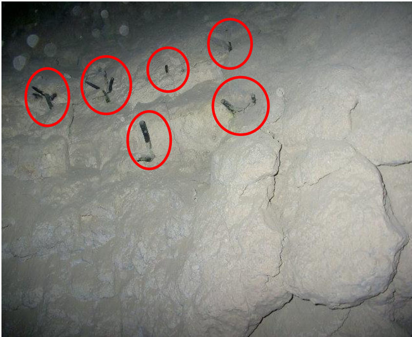
アンカーの露出(○の部分)