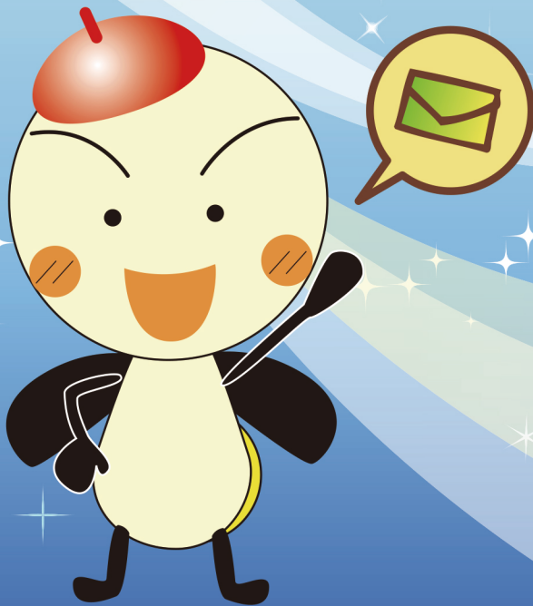
守山市PRキャラクター「モーリー」

守山市では、市民の皆様が安全で安心な生活を過ごせるために、 災害、気象、行政、地震、防犯に関する各種情報を メール機能を利用し配信しています！ 登録は無料ですので、是非ご活用ください。