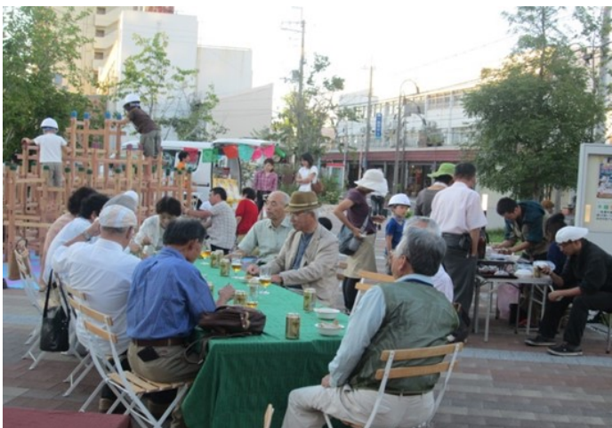
オーガニックビアガーデンパーティ

この取り組みは、健康・予防医学の取り組みの先導的な役割を果たすものであり、現在では、中心市街地の「あまが池親水緑地」において、毎月第2土曜日にオーガニックビールや野菜等を販売するマーケットや健康・予防医学に関する様々なイベントが定期開催されています。