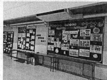
これまでのさんさん守山文化祭、もりやま市民活動屋台村の様子