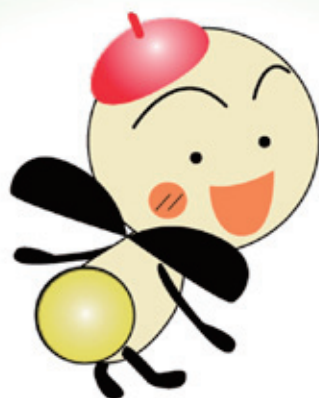
守山市 PR キャラクター 「もーりー」