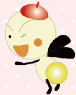
守山市PRキャラクター「もーりー」