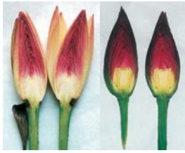
(妙蓮) (常蓮) 妙蓮と常蓮の断面比較

ミョウレン(妙蓮)は、被子植物の双子葉類・ハス科に属する大型の水生植物です。その葉や地下茎の様子は、普通のハス(常蓮)と違いはありませんが、花の様子に相違が見られます。