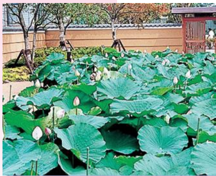
みょうれんのにわ

昭和40年3月26日 / 滋賀県天然記念物指定 昭和50年8月1日 / 守山市の市花に制定