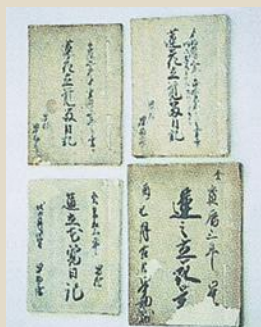
「蓮花立覚留日記」などの表紙

「妙蓮の御詠歌」冷泉家中興の祖といわれる歌人冷泉為村卿(1712～1774)や権大納言柳原光卿(1748～1800)などが妙蓮を詠じて田中家に贈った歌。