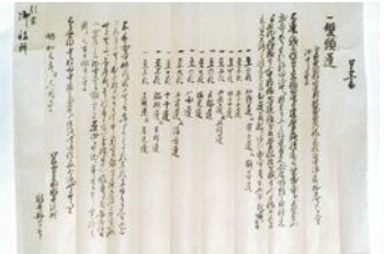
「双頭蓮口上書」明和元年(1764年)に江戸幕府に差し出された妙蓮いわれ書

京都はもちろん江戸でも、大名方など多くの人々の間で妙蓮が不思議な花として評判になっていました。宝暦13年(1763)には、丹波亀山藩主松平紀伊守が帰国の途中小ざざざ大日池に立ち寄りて妙蓮を見ています。また江戸時代を通じて皇室や官家あるいは公卿方、そして将軍秀忠、綱吉、吉宗や尾張家、紀伊家、加賀藩、膳所藩、大溝藩などや京都所司代、京都町奉行、西本願寺など多方面に妙蓮の花が献上されたという記録が残されています。花は枯れ花も尊ばれていたようです。散り落ちない不思議な花であるとともに安産の妙薬として貴重であったようです。