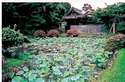
みょうれんいけ だいにちいけ

室町時代から永年の間、守り続けてきた妙蓮が再び絶えることがないように、近江妙蓮公園に新池を設置することで、妙蓮の保護育成をさらに強化しています。