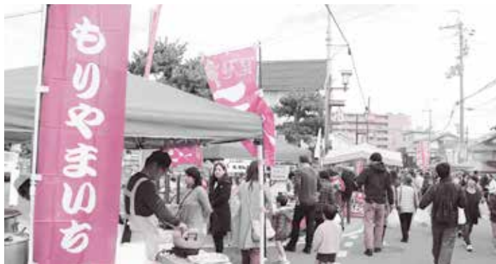
恒例「もりやまいち」の様子