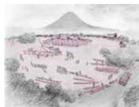
伊勢遺跡復元予想図(中井 純子 画)

なお、新型コロナウイルス感染症拡大防止のため、中止または変更する場合があります。当日は手指の消毒にご協力いただき、体調不良の人は参加を控えてください。