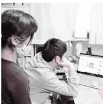
家族が集まるリビングで