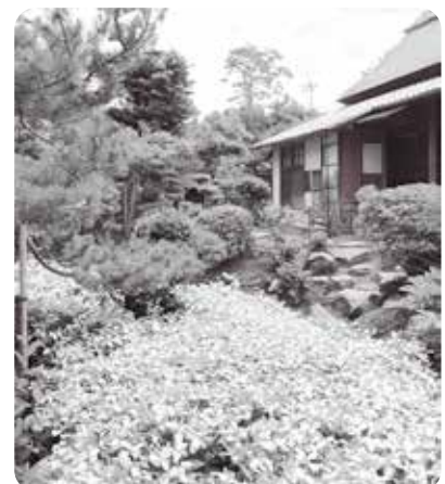
庭園に群生する半夏生