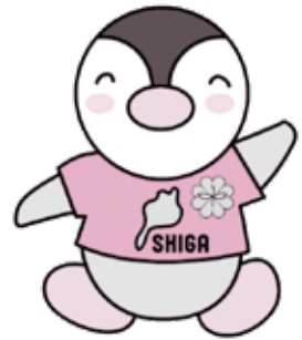
滋賀県民生委員・児童委員キャラクター「びわっ湖 ミンジー」

ひとり暮らしの高齢者や、高齢者のみの世帯、日中だけひとりで過ごしている高齢者の世帯を中心に、定期的に訪問して生活の困りごとがあれば相談にのっています。必要に応じて福祉制度を紹介したり、行政や関係機関につないだりして問題解決のお手伝いをします。