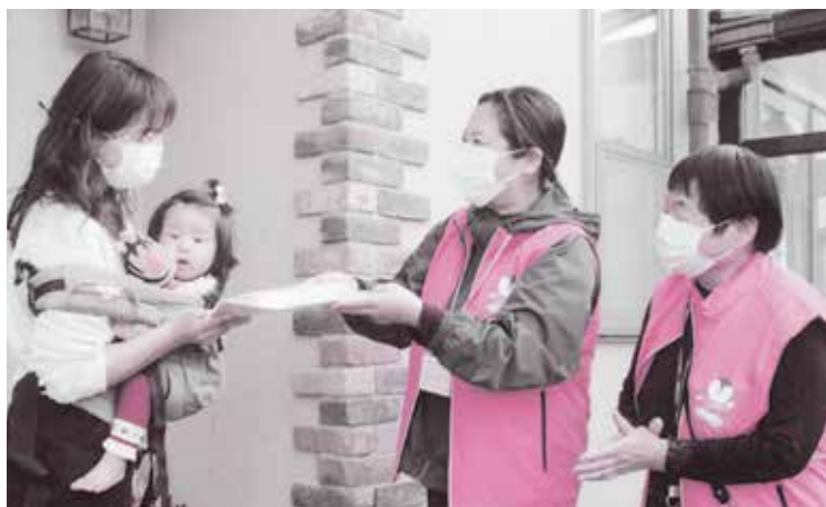
【こんにちは赤ちゃん訪問】(玉津学区の赤ちゃん訪問) 生後3カ月と1歳の赤ちゃんがいる家庭を訪問し、生まれてきてくれてありがとうという気持ちと子育て情報を伝える活動です。

民生委員・児童委員には「守秘義務」があり相談内容を他人に漏らすことはありませんので、安心して相談してください。