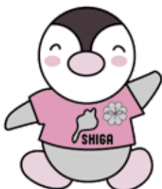
滋賀県民生委員・児童委員キャラクター「びわっ湖 ミンジー」