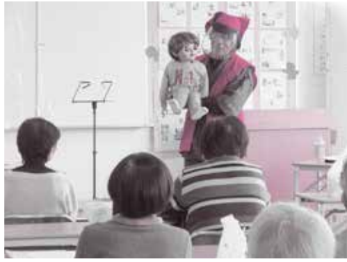
腹話術の元気くんは高齢者のアイドル