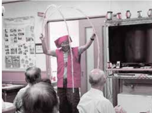
南京玉すだれの芸も披露します