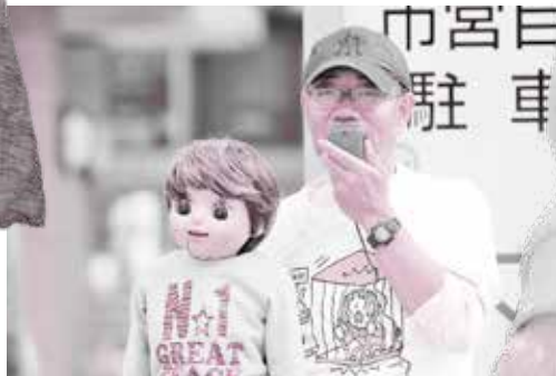
人権やコロナ、認知症などためになる話も