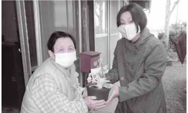
【高齢者の見守り】(中洲学区のお誕生日訪問) 高齢者世帯をさめ細やかに訪問し、さまざまな相談にのっています。