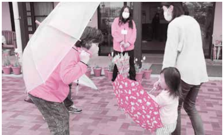
【あいさつ運動】(守山学区の校園あいさつ運動) 校園に分かれて「おはようございます」とあいさつを通じて子どもを はぐ 育てています。