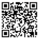
子育て相談・情報サイト一覧

令和元年度の市社会教育委員会議の提言書「子どもの育ちと家庭教育について」に基づき、市ホームページ内に「子育て相談・情報サイト一覧」ページを開設しました。子育てに関する悩みや困りごとなどがある人はぜひご覧ください。