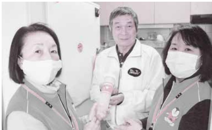
【命のボタン】(吉身学区の命のボタン総点検運動) 緊急時、救急隊員などに必要な情報を知らせるために、医療情報などを冷蔵庫で保管する「命のボタン」を配布し保管状況を点検しています。

地域で活動している 民生委員・児童委員について知ってください。 「見守り」「相談」「つなぐ」を柱に 活動しています。