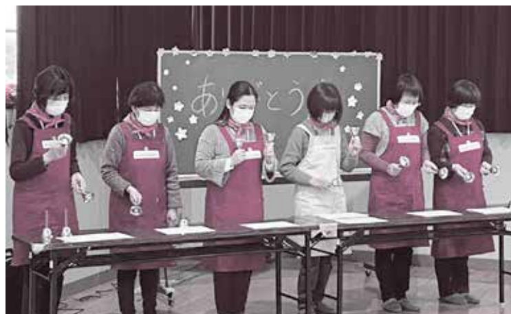
【子育て支援】(ほほえみセンターで活動する主任児童委員) 子どもたちと関わり、保護者と子育ての話をしたり相談にのったりしています。