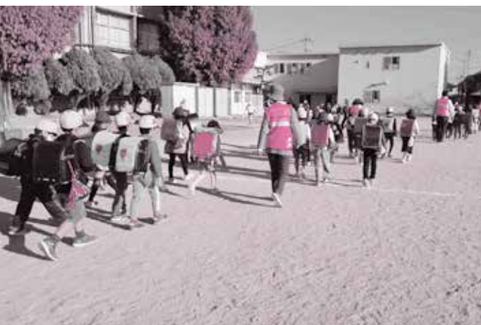
【子どもの見守り】(河西学区の下校同行) 子どもの安全・安心を守るため、登下校時の見守りを行っています。