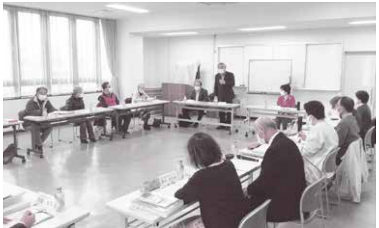
【各種団体との協働】(速野学区の地域支援ネットワーク委員会) 地域福祉の推進役を担い、関係団体などと協働し、安全・安心なまちづくりに取り組んでいます。