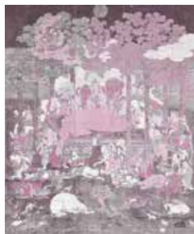
市指定文化財・涅槃図 (速野学区・観音寺)

☎ (582)1156 ☎ (582)9441 ✉ bunkazai@city.moriyama.lg.jp