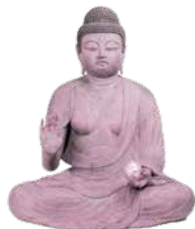
市指定文化財・薬師如来坐像 (吉身学区・慈眼寺)