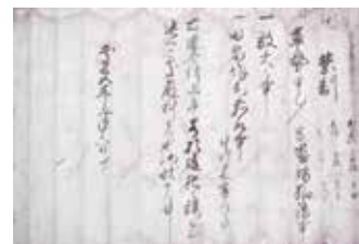
市指定文化財・諏訪家関係資料のうち徳川家康朱印状 (玉津学区・大庄屋諏訪家屋敷)