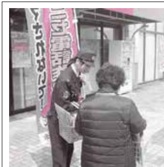
特殊詐欺の街頭啓発

自助 改元を悪用した詐欺に注意 全国的に改元に便乗した詐欺が多発しています。元号が変わるので、キャッシュカードを新しくする必要があるので電話で説明され、それを信じてキャッシュカードを渡してしまい、現金を引き出される被害が発生しています。今後もしまざままな手口で、改元を悪用した詐欺が続くおそれがありますので、十分注意してください。 相手が誰であっても、改元などを理由に、いきなり電話やメールで、現金やキャッシュカードを要求することはありません。このような電話や不審な手紙が届いたら、すぐに信用せずに詐欺と疑い、守山警察署(☎(583)0110)に相談ください。