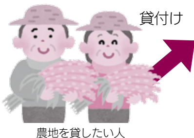
農地を貸したい人