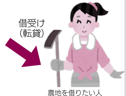
農地を借りたい人

📅 5月7日(火)～6月28日(金)に申請書に記入し、農政課またはJAおうみ富士守山営農センターへ申請。申請書は上記に設置。または公益財団法人滋賀県農林漁業担い手育成基金のホームページからダウンロード。