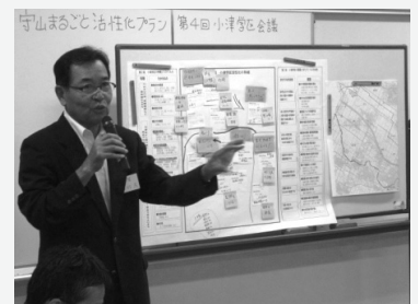
▲結果を発表し参加者で共有