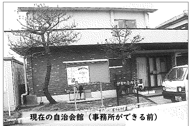
現在の自治会館（事務所ができる前）