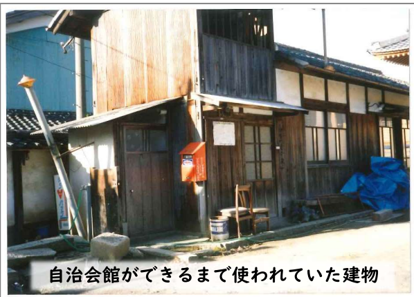
自治会館ができるまで使われていた建物

この自治会館ができる前は永願寺（お寺）の山門を入った左側に約14畳の平屋の建物があり、そこで会議などを行っていました。当時は約40世帯程の住民でしたので、間に合っていました。この建物は現在はありません。