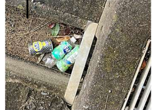
排水溝に ポイ捨てされた ペットボトルと 空き缶

10月31日衆議院議員総選挙、最高裁判所裁判官国民審査が行われました。町民の皆さん、投票に行けましたか。一人ひとりが一票を行使することは国民の権利であり、義務でもあります。とはいうものの、投票率を見る限り、厳しい結果が出ています。