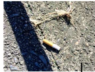
道路に ポイ捨てされた たばこ