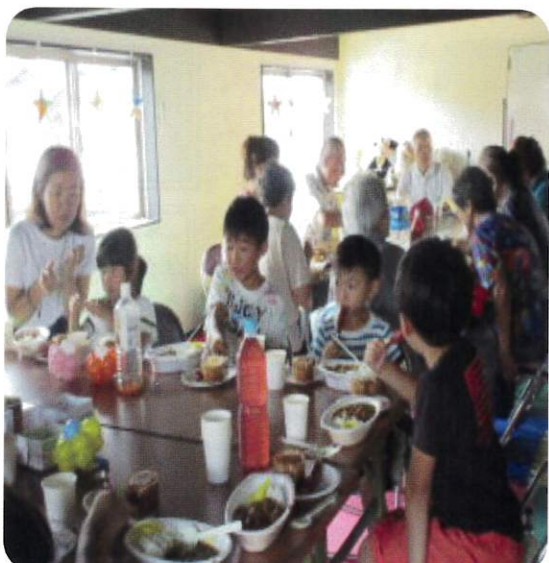
↑ふれあい食堂の様子