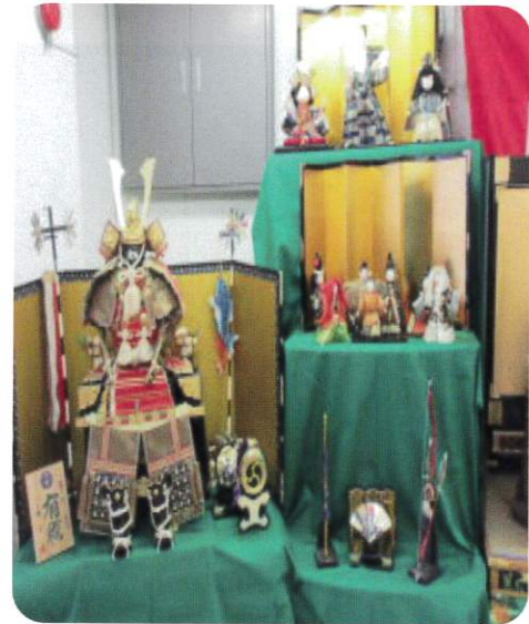
↑五月・武者人形の展示の様子

おります。地域の皆様をはじめ市外からも気軽に来ていただき楽しいひと時を過ごせる場となりますように活動してまいります。