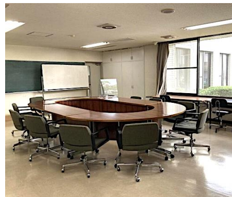
図4 市民活動スペース（交流室）