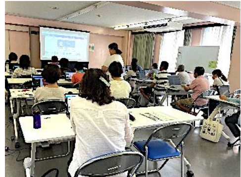
図2 さんさんまちサポセミナー

市民活動団体の活動に有益なセミナー「さんさんまちサポセミナー」（令和4年度実績：10回開催、113名参加）や、市民のまちづくりへの機運醸成のため「市民参加と協働のまちづくりフォーラム」（令和5年度実績：2回開催、109名参加）などを定期的に行っている。市民活動や地域活動の実践者のニーズを捉えた講座等を開講するとともに、今後は中間支援を担う専門人材の育成も視野に入れることが肝要である。