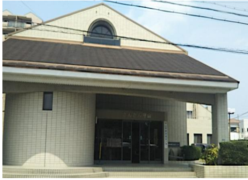
図1 守山市民交流センター