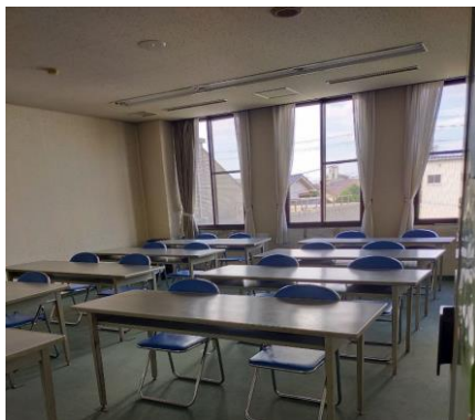
図3 文化活動スペース

令和4年度の施設全体の年間利用者数は39,581人である。前述したように、「守山市民交流センター」には、「文化活動スペース」のほかに市民活動団体が利用できる「市民活動スペース（交流室、ミーティング室、サロンルーム、作業室）」があり、会議や簡易なイベントにも活用できる「市民活動の拠点」となっている。「文化活動スペース」の利用率は、49.9%に対し、「市民活動スペース」は同23.9%であり、周知不足が主因となり、利用が特定の団体に限定されていることが課題である。