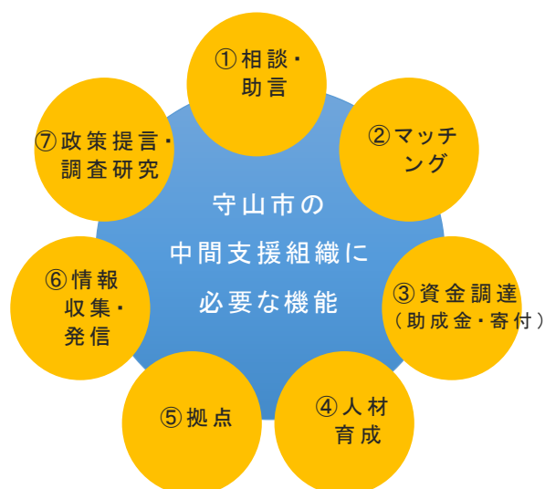
図 6 必要な 7 つの機能