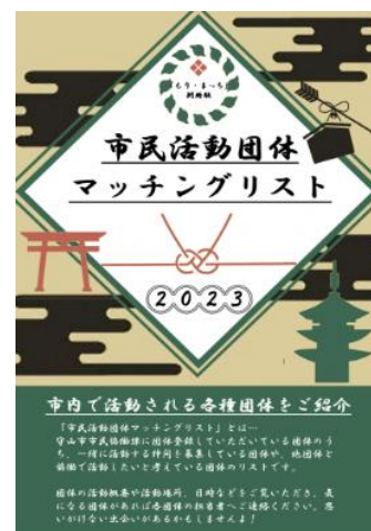
図 5 マッチングリスト

情報発信については、市のホームページを活用し、助成金の情報等を掲載している。しかしながら、研究会では「当該ページにアクセスしても、求めている情報が見つからない」といった意見が多く聞かれた。求める情報にたどり着けるよう、利用者目線に立った情報と導線の整理が必要である。これ以外には、「団体等が SNS を通じて発信できるような仕組みをつくってほしい」というように、団体等が主催するイベントの周知や参加者募集などを行うことができる、速達性の高い情報発信ツールの必要性が指摘されている。