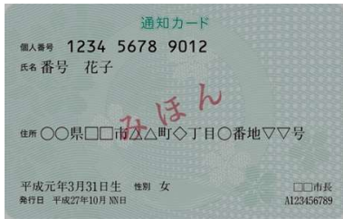
（通知カード みほん）