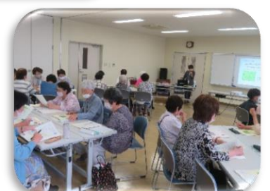
第 2 回学習会