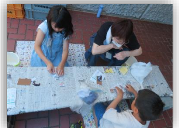
まが玉作りの様子

河西小学校の 2 年生から 5 年生までの 29 名が午前・午後の部に分かれて挑戦しました。四角い石からくぼみのある「まが玉」になるまで根気よく削り仕上げました。世界にひとつだけの「まが玉」を首飾りにして大切に持って帰りました。「削るのが大変だったけど、また作りたい！」などのうれしい感想を聞くことが出来ました。