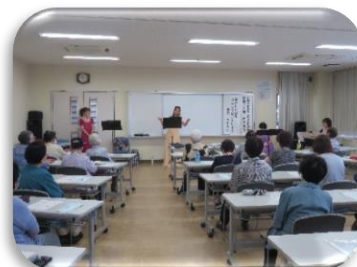
第 1 回学習会

第 1 回学習会では、市内で活動しておられる「てちないさん」をお招きして、みんなで懐かしい歌を歌い、楽しい時間を過ごしました。第 2 回学習会では、市在宅医療・介護連携サポートセンターによるエンディングノートについて学習しました。最後まで自分らしく生きるためにエンディングノートを作成するという話に学級生の皆さんは「知らなかった！」と驚いていました。