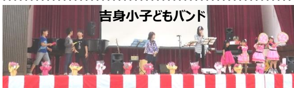
吉身子どもバンド