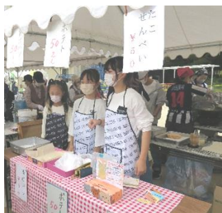
子どもサポーター(模擬店)