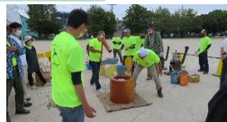
スポーツコーナー