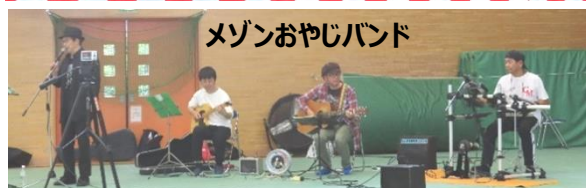
メゾンおやじバンド