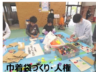
巾着袋づくり・人権