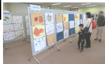
作品展示コーナー