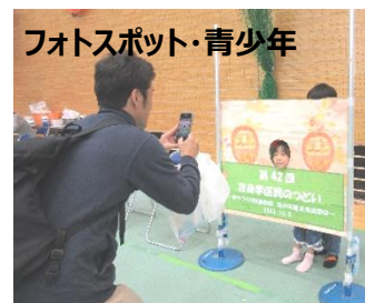
フォトスポット・青少年