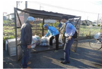
ごみ集積所立ち合い啓発