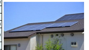
住宅のソーラーパネル