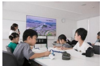
もりやまエコパーク交流拠点施設での環境学習