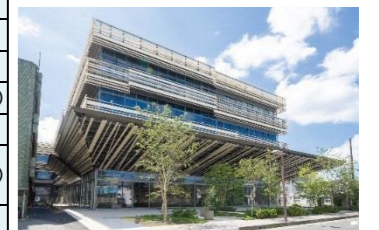
省CO 2 技術の導入によりZEB Readyを達成した新庁舎