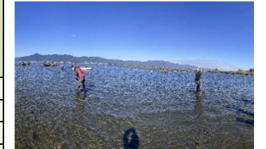
琵琶湖・赤野井湾