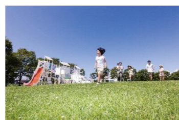
びわこ地球市民の森