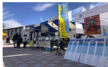
もりやまエコフェスタ