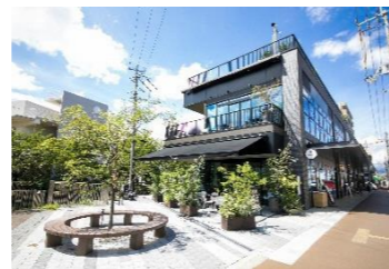
銀座商店街の再開発