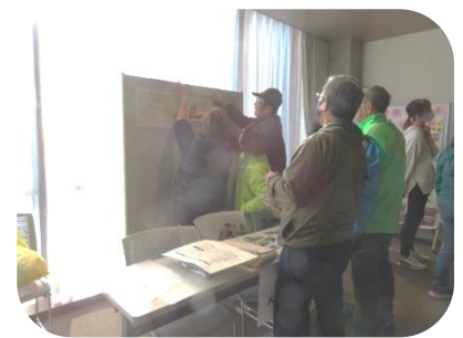
↑団体による展示の準備 ↓段ボールめいろのみんまで組立中です。