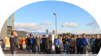
↑本番前の集合です。一日よろしくお祈りします。