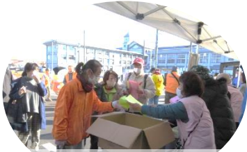
寒い中記念品の配布ありがとうございます。