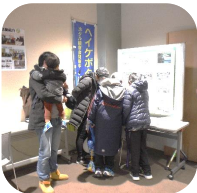
↑ホタルの幼虫に興味津々です。 ↓クラフト体験に夢中です。