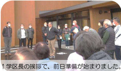
↑学区長の挨拶で、前日準備が始まりました。