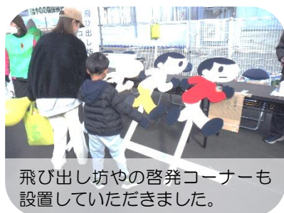
飛び出し坊やの啓発コーナーも設置していただきました。