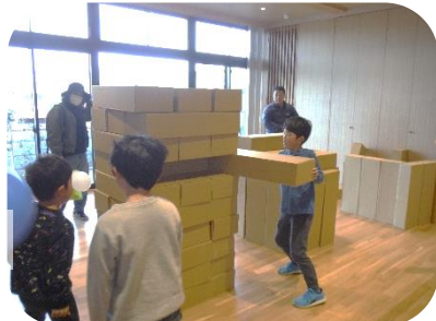
↑子どもたちに人気の段ボールブロック遊び ↓展示コーナーも賑わっています。