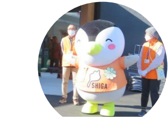
ミンジーも参加してくれました。