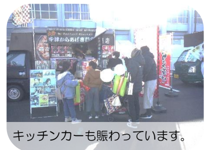
キッチンカーも賑わっています。