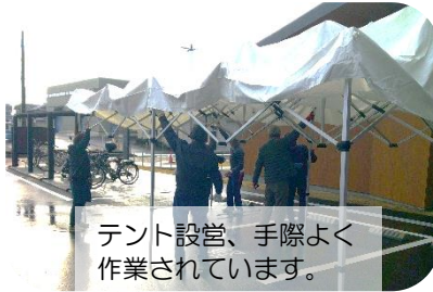
テント設営、手際よく作業されています。