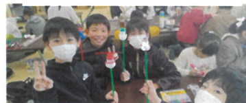
★みんなで雪だるまに絵付け

最後はお菓子のプレゼントを持ち帰ってもらい、とても良いクリスマス会になりました。ご協力いただいた皆様ありがとうございました。