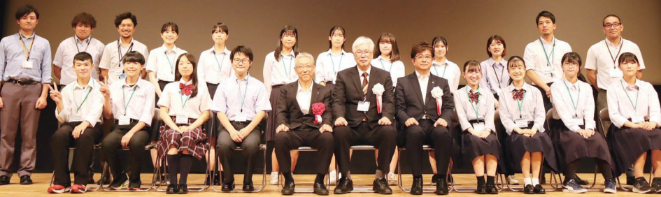
令和5年度 第26回 中学生広場「私の思い2023」守山大会