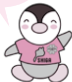
滋賀県民生委員・ 児童委員キャラクター 「びわっ湖 ミンジー」