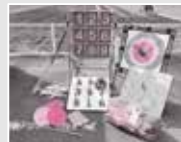
レクリエーション用品

かき氷機やポップコーン機、輪投げなどのレクリエーション用品など、イベントで使うことができる機器を、市内の団体へ貸し出しています。借用申請は、借用希望日の属する月の3カ月前の1日からです。