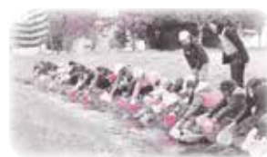
子どもたちの幼虫放流

自然との共生という点では、子どもたちが先生です。普段から水辺や河川の植物や生き物に親しめる活動をしています。