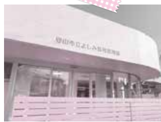
今年4月に開園したよしみ乳児保育園(左)とフェリーチェ今宿保育園(右)

さて、昨年度82人もの待機児童が発生し、これまで、よしみ乳児保育園やフェリーチェ今宿保育園の開園、保育士確保のための民間園に対する支援など、ハード・ソフト両面での対策に最大限取り組んできたところですが、保育ニーズの高まりや低年齢化、保育士確保が困難な状況が続いていることから、今年度もいまだ多くの待機児童が生じており、大変申し訳なく思っております。このことを真摯に受け止め、今後も令和7～8年度の開園に向けた新園の整備、手当などの拡充や保育ソーシャルワーカーの配置による保育士の定着化・確保に向けた取り組みなどを進め、早期の待機児童解消を目指します。