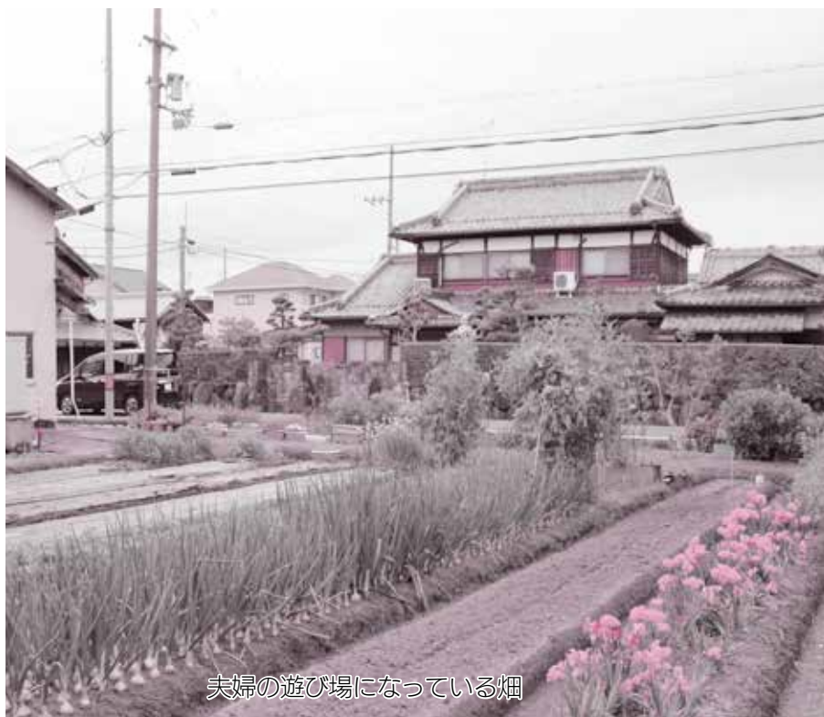
夫婦の遊び場になっている畑