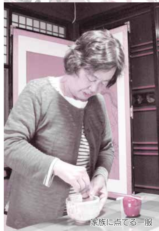
家族に点てる一服

晩春～初夏はフリージアが満開になります。初枝さんは「フリージアは色鮮やかで香りもいいの。それに、花言葉の「感謝」は私の気持ちにぴったりなのよ」と話していました。