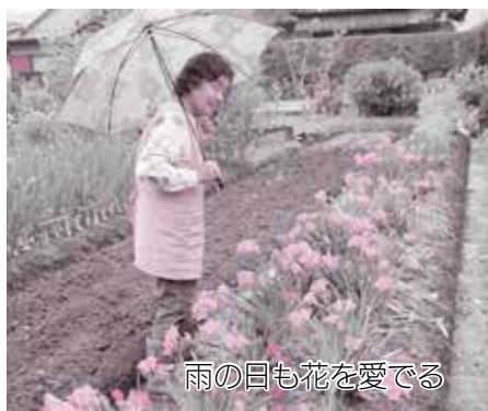
雨の日も花を愛でる