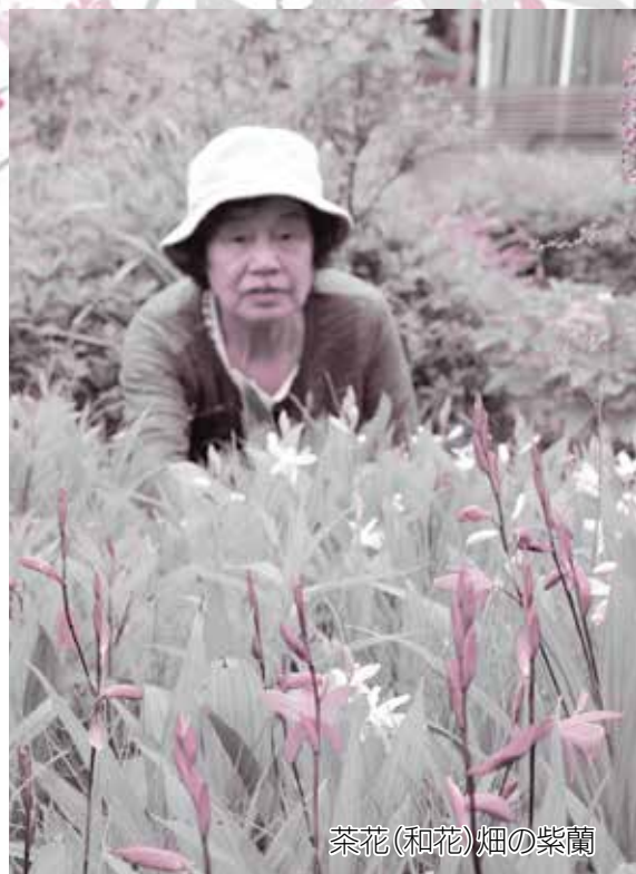
茶花(和花)畑の紫蘭