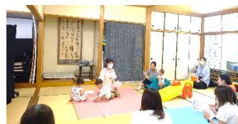
歯科衛生士さん歯のお話