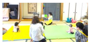
子育てサロン「ひまわり」

育休中のパパ、ぜひ参加してください。ママ、パパ、おばあちゃん、おじいちゃん大歓迎