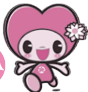
守山市社協キャラクター もりびー