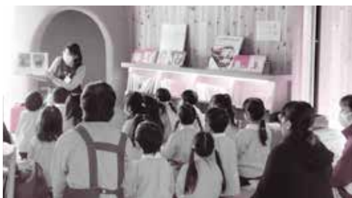
↑北部図書館で絵本の読み聞かせ ↓新しい図書館の見学ツアー