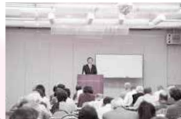
つがやま市民教養文化講座の様子