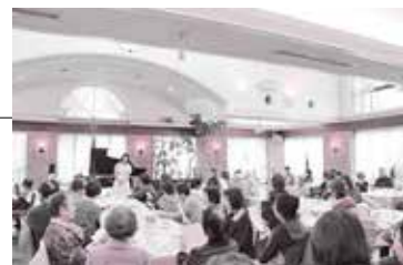
メモリアルコンサートの様子

また、8月25日(日)は「夏休み親子教室」も復活します。今回は望遠鏡の仕組みを学び、実際に作ります。