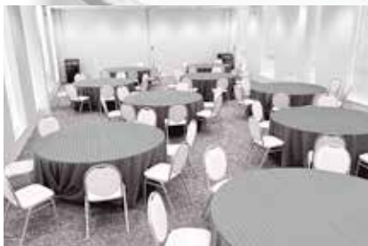
宴会やパーティー時