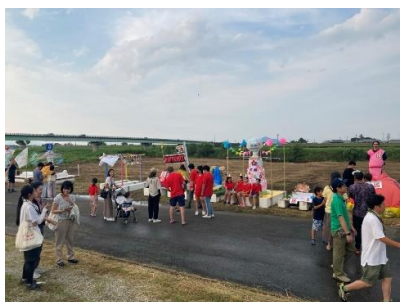
【いかだコンテスト】

7月6日(土)は予定通り午前10時に会場開放を行い、参加者が自分たち各々でいかだづくりを行った。午前中はやや参加者が少なかったが、午後には多くの参加者が集まった。途中雷鳴が聞こえたため約30分作業を中断した。午後5時30分に30分遅れでいかだコンテストを行った。テーマ性をもたせたものやデザインに凝った作品もみられ、各艇のアピールも練られており、大変盛り上がった。午後6時40分より前夜祭を10分遅れで開催した。会場には約350名が来場し、ステージイベントや模擬店を楽しんだ。水位、天気予報とも大きな問題なく、翌日のいかだくだりは実施される見込みで前夜祭を終えた。