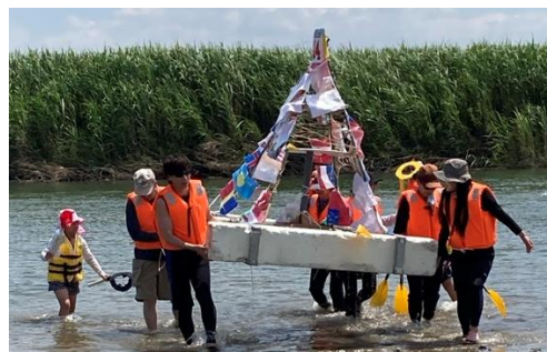
【いかだくだりの様子】