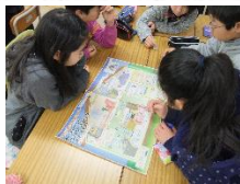
↑ 実際の講座の様子