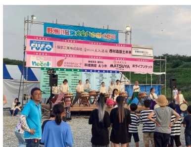
【ステージイベント】