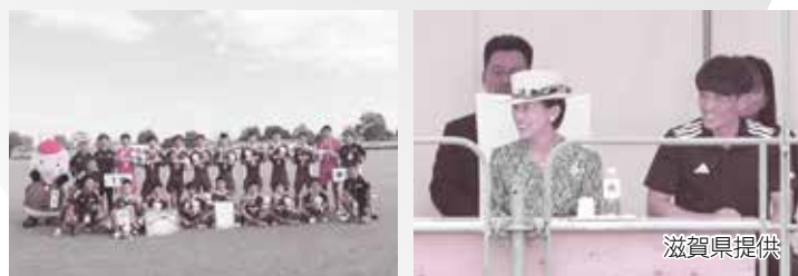
優勝：東京都。滋賀県勢は初戦惜敗

1981年に開催された「びわこ国体・びわこ大会」以来44年ぶり2度目の開催となった「わたSHIGA輝く国スポ・障スポ」が、皆さまのご支援・ご協力、そしてたくさんのご声援のおかげをもちまして閉幕となりました。