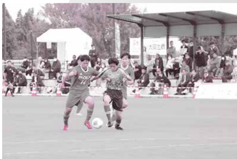
優勝：鹿児島県。滋賀県勢は初戦惜敗