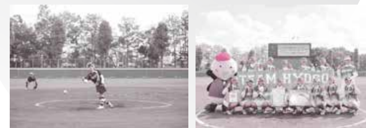
優勝：兵庫県。滋賀県勢は準決勝惜敗