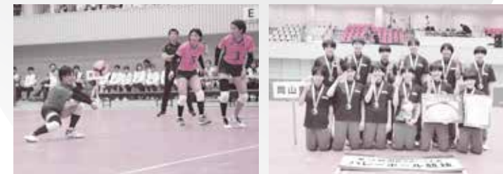
優勝：岡山県。滋賀県勢は2回戦惜敗