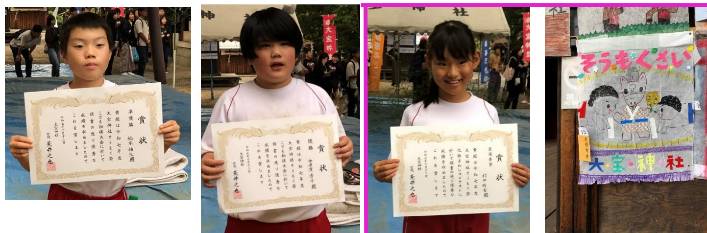
手作り化粧まわしコンテスト最優秀賞