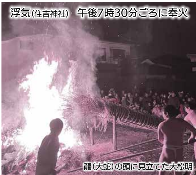
龍(大蛇)の頭に見立てた大松明