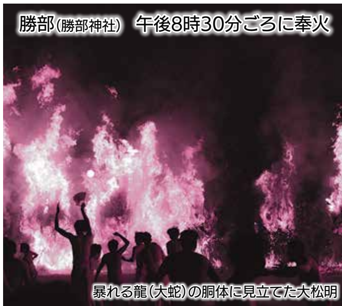
暴れる龍(大蛇)の胴体に見立てた大松明