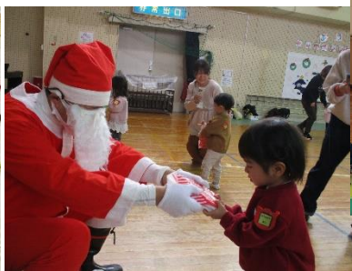
なかよしひろばXマス 12/8