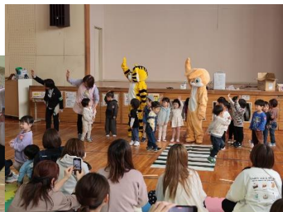
幼児クラブ交通教室 11/7