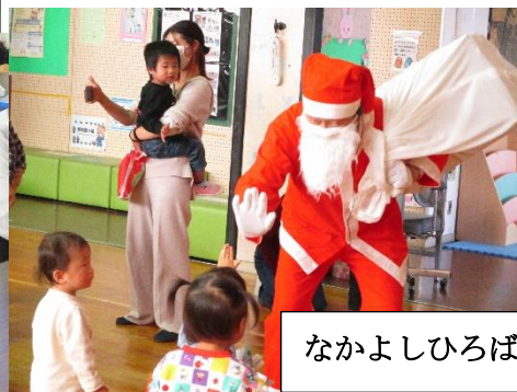
なかよしひろばXマス 12/1