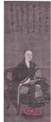
県指定・一休宗純像 少林寺蔵