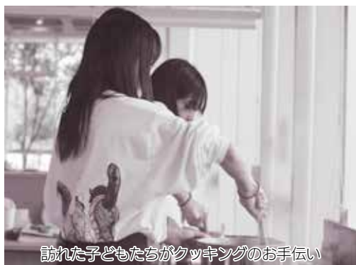
訪れた子どもたちがクッキングのお手伝い

取材にお邪魔した日は、2人の子どもが参加して、ランチのミートソースのパスタとスー