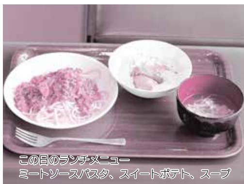
この日のランチメニュー ミートソースパスタ、スイートポテト、スープ

トポテトを作るお手伝いをしていました。スタッフと一緒に料理やおしゃべりを楽しんだり、パーク内に遊びに行ったりして過ごしていました。その間に保護者は、スタッフに心と体の健康相談をしていました。