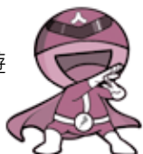
滋賀県人権啓発 キャラクター ジンケンダー