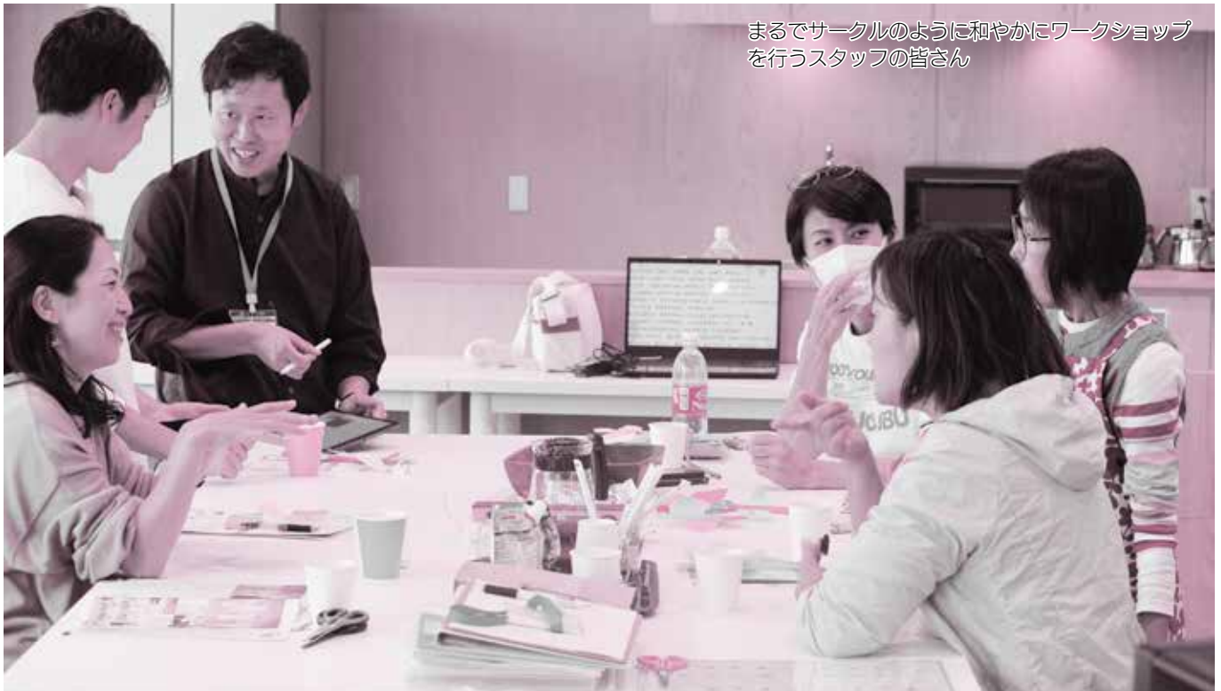
まるでサークルのように和やかにワークショップ を行うスタッフの皆さん

おうみ子ども・若者未来のタネプロジェクト(タネプロ) 学校に行きづらい親子を応援する まちのほけんしつ活動