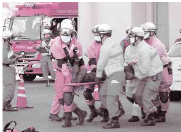
過去の訓練の様子