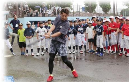
野球教室 (鳥谷敬氏)