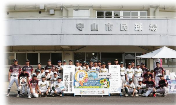
守山TCマスターズ・守山南中学校