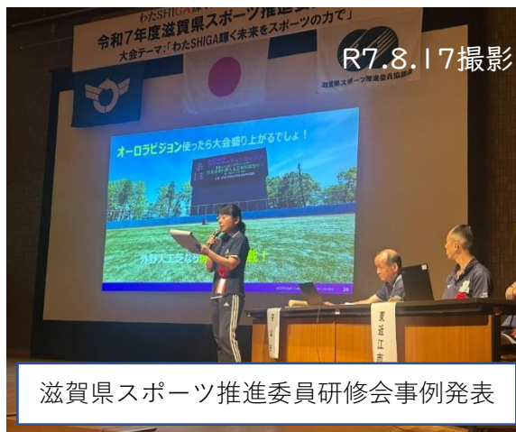
滋賀県スポーツ推進委員研修会事例発表