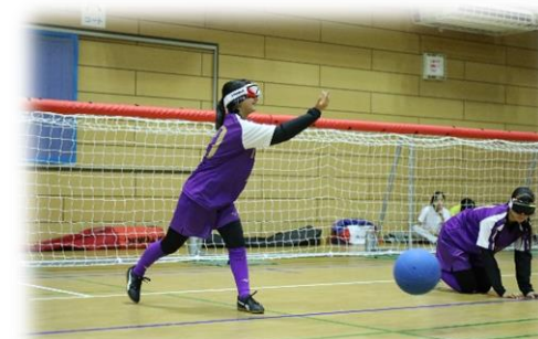
ゴールボール(中学生・高校生の部)