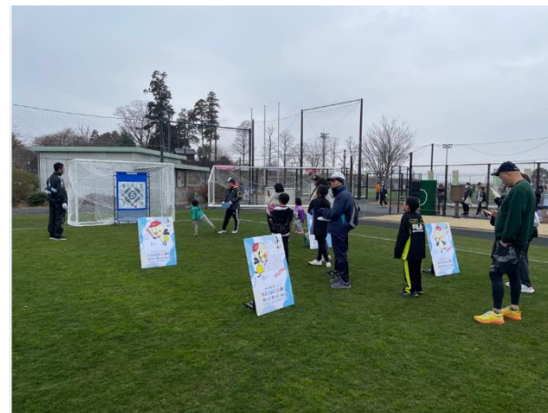
スポーツ体験コーナー