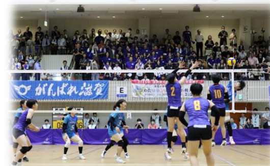
試合風景(バレーボール)