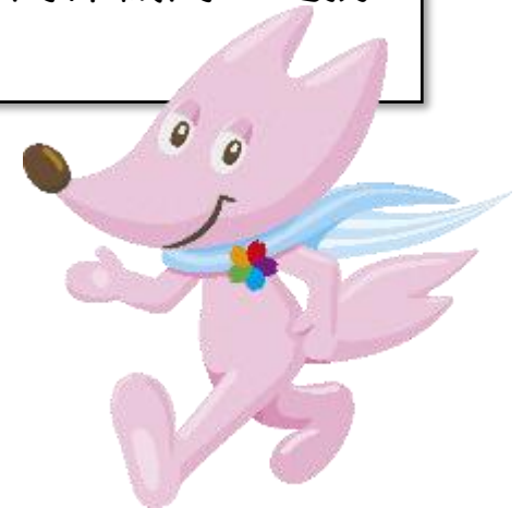
大会マスコット「スフラ」