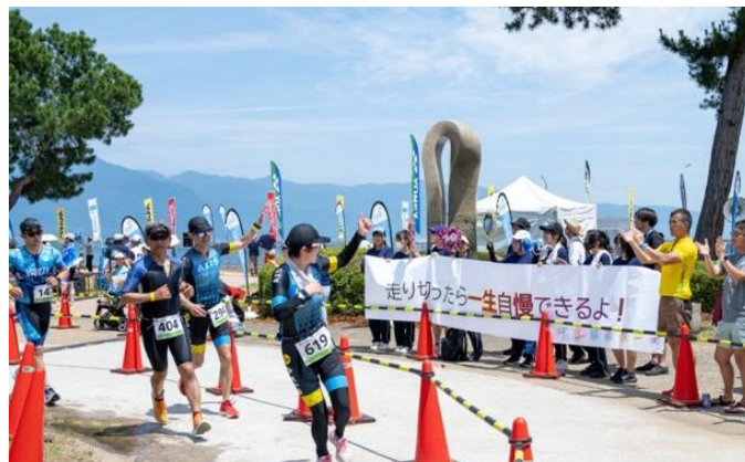
競技者・応援者が一体となって盛り上げる