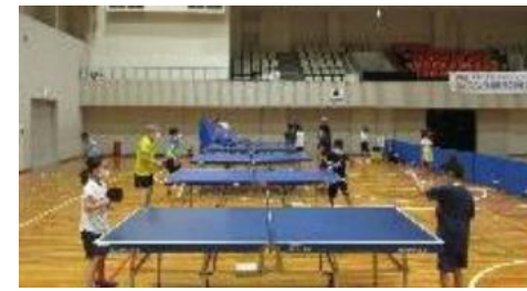
ジュニア卓球クラブの様子