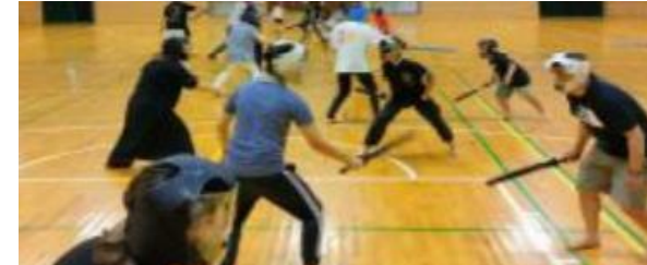
親子チャレンジ教室の様子