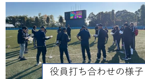
役員打ち合わせの様子