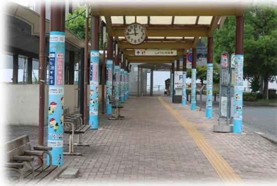
企業協賛(駅前装飾)