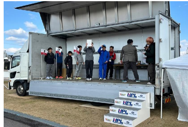
トラック上での表彰式