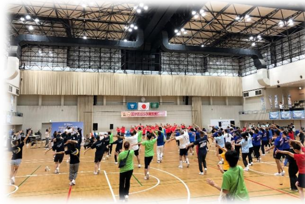
スローエアロビック