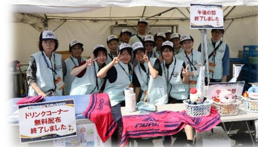
ボランティア(おもてなし)