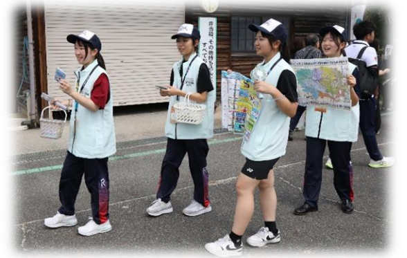
大会運営ボランティア