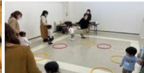
親子リトミックの様子