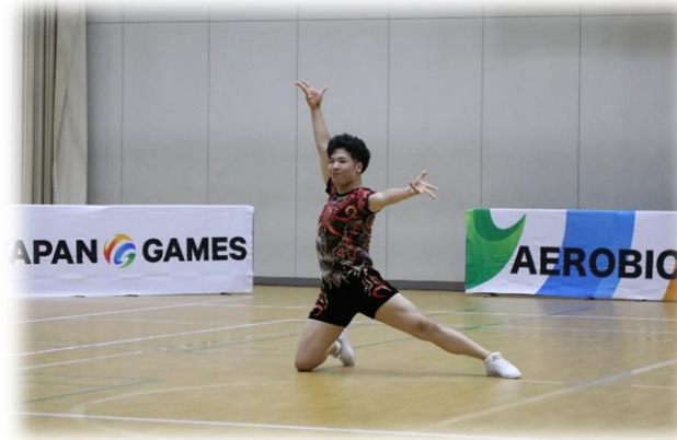
演技風景 (エアロダンス種目)

少年からシニアまで幅広い世代が競技を行うことから、 生涯スポーツとして、今後もますます注目されていくことが期待される。