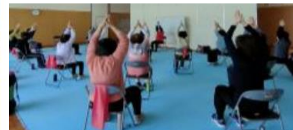
健康体操クラブの様子