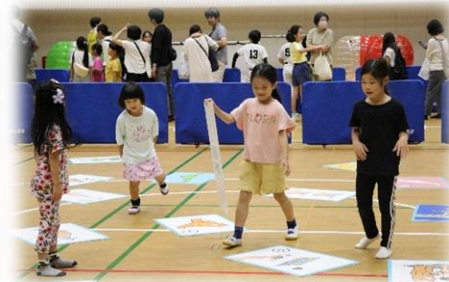
ゆるスポーツ体験 (スポーツかるた)