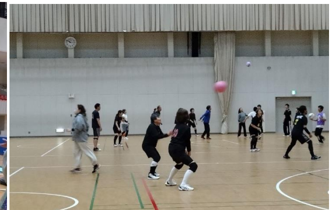
ソフトバレーボール