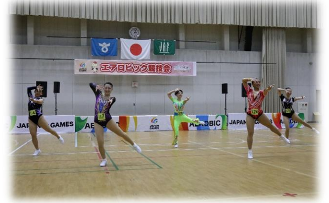
演技風景 (フライト種目)