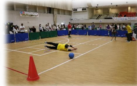
ゴールボール体験