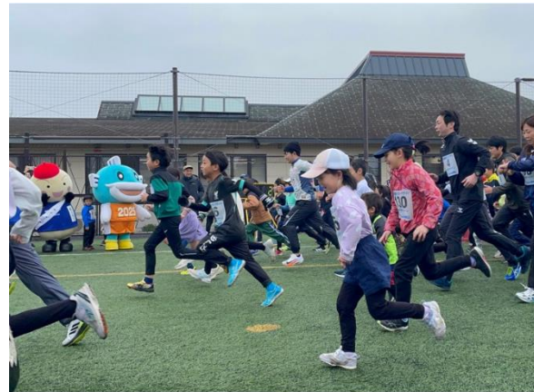
2kmの部（ビッグレイク）

また、お楽しみコーナーでは軽食販売やスポーツ体験を実施する。ほか、お魚ふれあいコーナーを設け、子どもたちを中心に野洲川に触れる貴重な機会創出を図る。