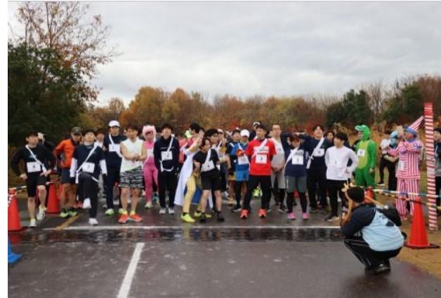
リレーマラソンスタート

また、会場では、キッチンカーやアニマル仮装大賞コンテスト、シャボン玉体験のコーナー、自転車補助輪外し教室、ふわふわ遊具、バブルボール、豚汁ふるまいなど、回を重ねるごとにイベントも充実し、ランナーのみならず来場者を楽しませた。