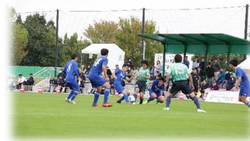
サッカー(試合風景)