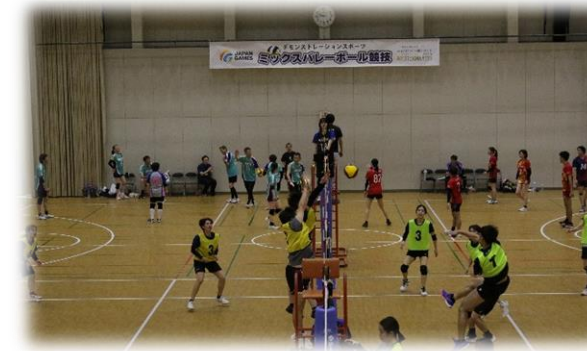
ミックスバレー（一般の部）

デモンストレーションスポーツは、気軽に参加できる部門があることから、 世代や経験を超えた交流が生まれ、スポーツの持つ「つながりの力」を改めて実感できる機会 となった。