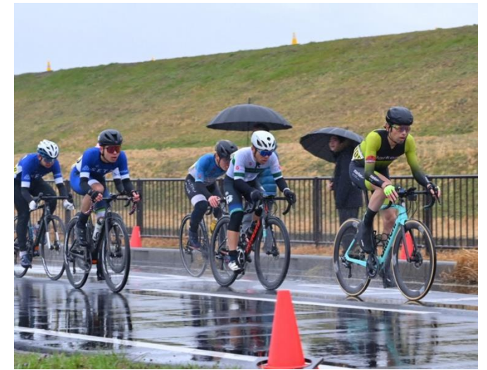
昨年度大会 雨中の激戦