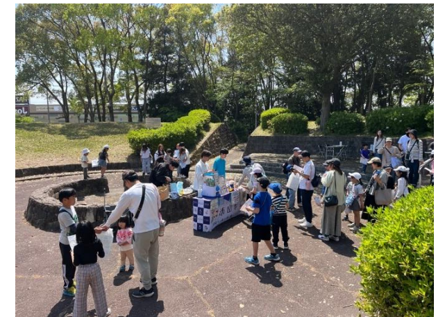
国スポ・障スポ応援ブース