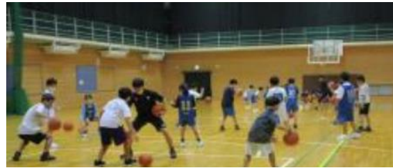
バスケットボール教室の様子

文化体育振興事業団による市民運動公園内の各施設の利用を促進するための事業。トップアスリートによるバスケットボール教室や陸上教室からスポーツチャンバラなどの親子参加型体験教室まで幅広くプログラムを展開することで、様々な層に向けてスポーツ振興を図る。