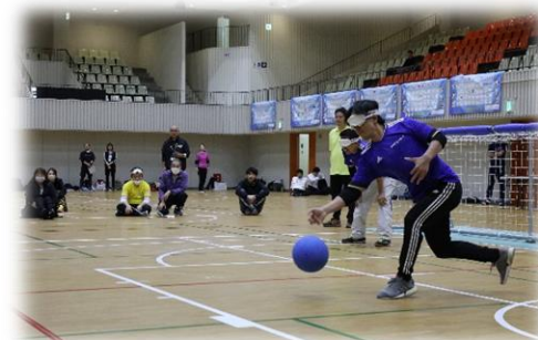
ゴールボール(一般の部)

体験会や学校観戦を通じて、子どもたちの障害者理解・パラスポーツの理解・関心を高めることができた。