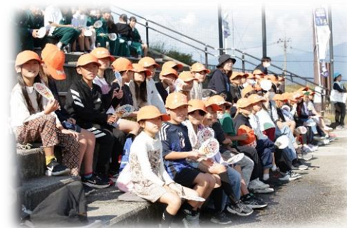
サッカー(学校観戦)