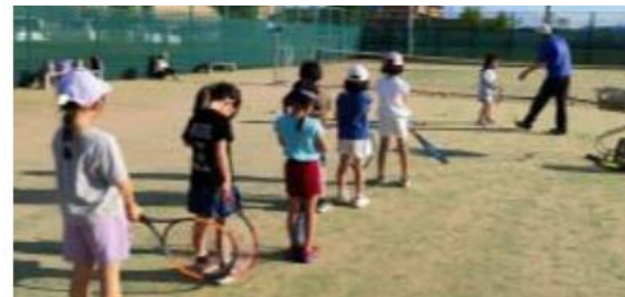
ジュニアテニスクラブの様子