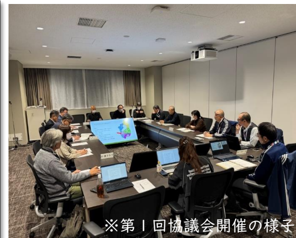
※第1回協議会開催の様子

総合型地域スポーツクラブが持続的に地域スポーツの担い手としての役割を果たし、「質的な充実」に重点を移していくため、各学区のそれぞれの取り組みや活動状況等の実態を情報交換する場として、R6年度第1回連絡協議会を開催した。令和7年度3月に第2回協議会の開催を予定しており、引き続き、学区ごとの課題抽出を行うとともに、課題解決に向けた協議を実施していく。