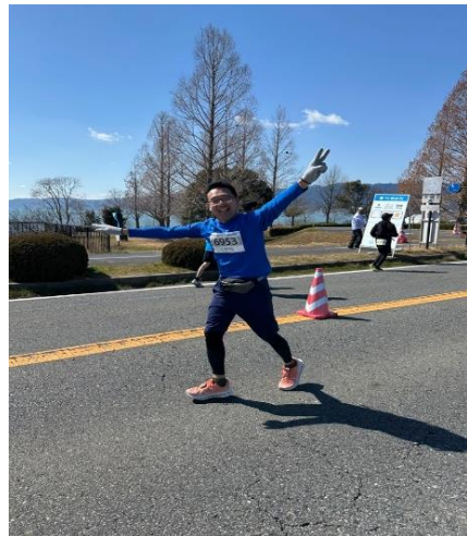
市長もランナーとして参加