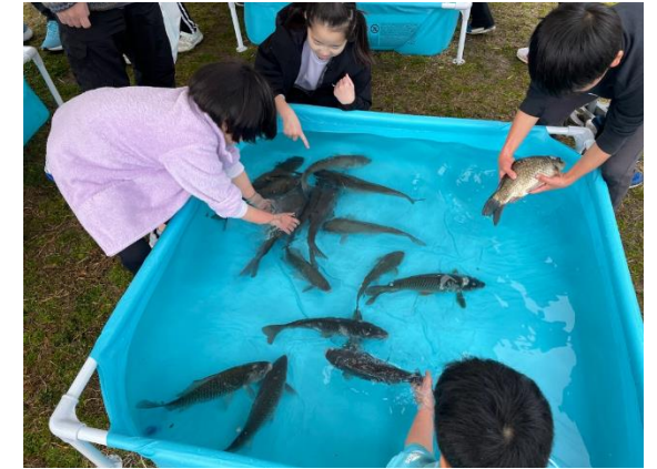
お楽しみコーナー（お魚ふれあいコーナー）