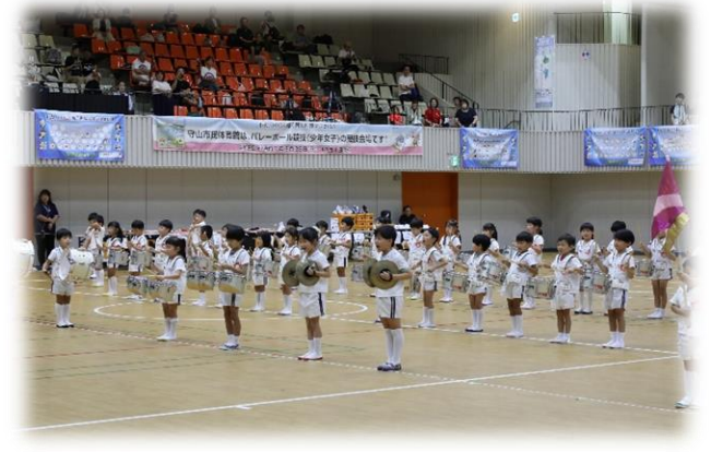
デモンストレーション (カナリヤ保育園鼓隊)