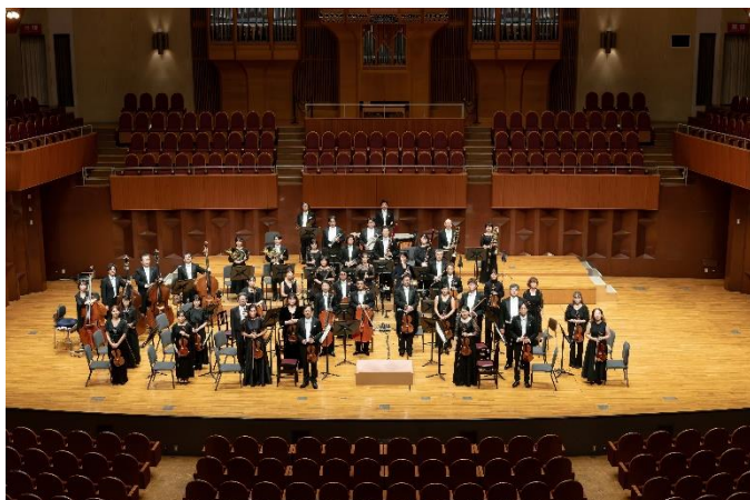
日本センチュリー交響楽団