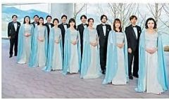
びわ湖ホール声楽アンサンブル

びわ湖ホール独自の創造活動の核としてホール開館の1998年に設立。「声楽アンサンブル」とは、ドイツ語圏の歌劇場においてオペラのソリストを担う劇場専属歌手を意味する。オペラや定期公演などのびわ湖ホール自主公演へ出演するほか、全国各地で多数の公演を行う。また滋賀県内の学校を対象とした音楽の普及活動も積極的にを行っている。2013年度第26回大津市文化賞、2017年第42回滋賀県文化賞受賞。