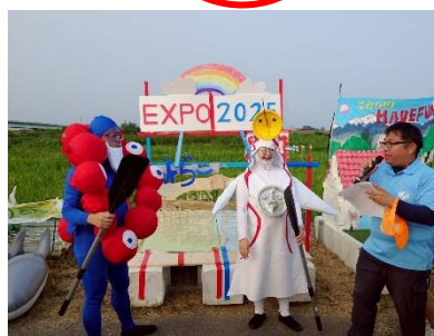
いかだコンテスト