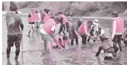
アユの産卵床づくり(昨年8月実施)の様子