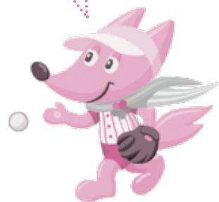
大会マスコット「スフラ」 ～Sport for Life～