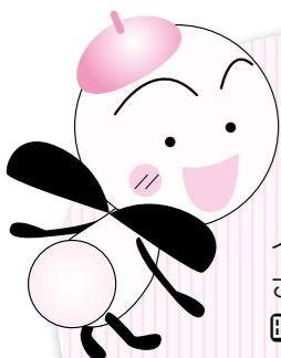
守山市 PRキャラクター もーりー