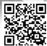
守山ほたるパーク&ウォーク実行委員会 ホームページ

幻想的な光を放つゲンジボタルを観賞して、清らかな水辺環境を守ることの大切さを感じながら、守山の初夏を楽しみませんか。 観賞スポット：三津川、目田川、市民運動公園