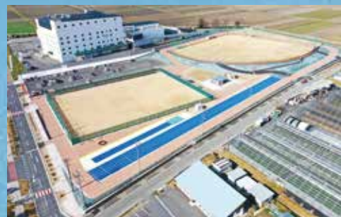
完成した、もりやまエコパーク西エリア