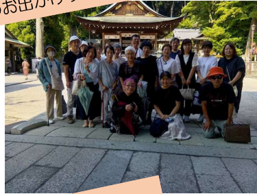
植付の湯、涼みの湯