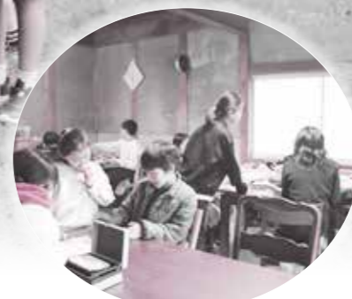
室内で思い思いに過ごす子どもたち