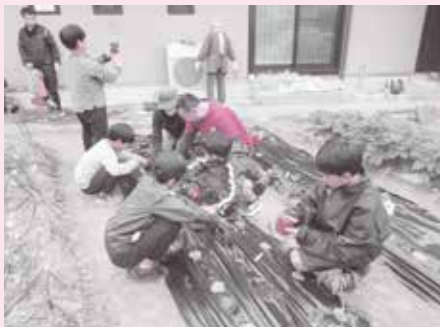
子ども農園で野菜づくり(エイブラハム林間学校)