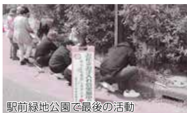
駅前緑地公園で最後の活動

平成20年に始まった、市立図書館横の目田川沿いに桜並木を創る計画では、数年をかけてオーナー制度によるソメイヨシノの植樹を実施しました。桜の季節にはオーナー家族をはじめ、多くの市民が桜並木に集い、「桜まつり」を開催してきました。