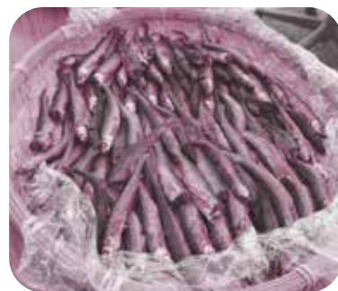
ホンモロコの佃煮