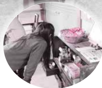
おやつが買える駄菓子屋コーナー