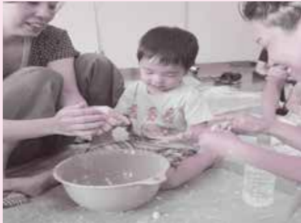
小麦粉粘土で遊ぶ親子(bochibochi sloth)