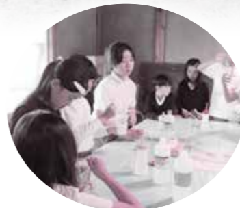
みんなで遊べるプチイベントも

石田町の民家に、地域の子どもたちが集まって庭で過ごしたりマンガを読んだり、自由に遊べる「こどもの居場所とあそび場～みんなのひみつきち」（以降：みんきち）があります。