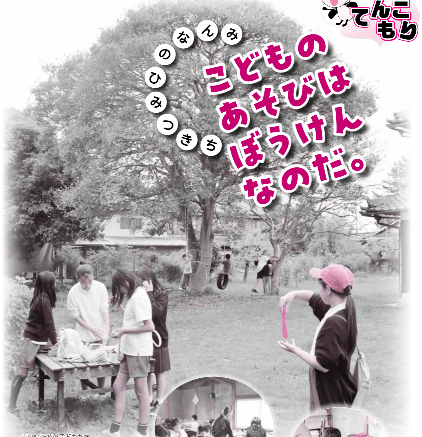
広い庭で遊ぶ子どもたち