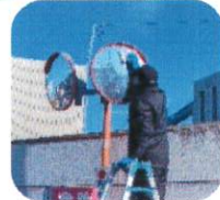
白線引き・ カーブミラー清掃 12/13(土)