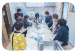
趣味の教室 お漬物教室 12/6・13・28