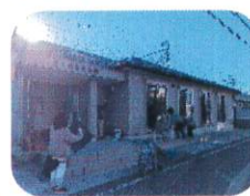
自治会館大掃除と 避難訓練 12/13(土)