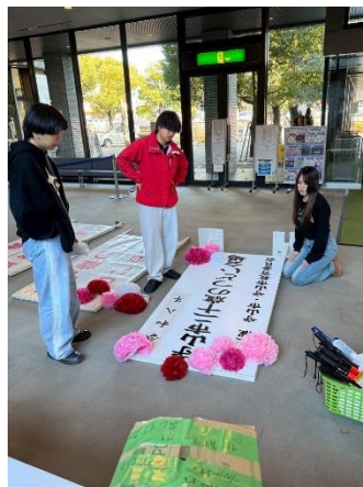
看板の飾りつけにもこだわる！