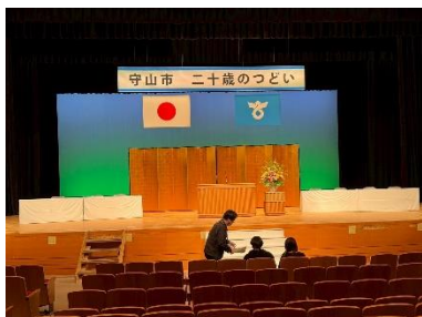
ホールの方（プロ）が教えてくれます。