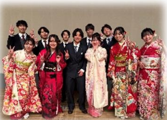
終わってホッとした。