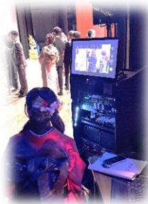
機器も自分たちで操作