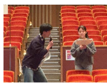
当たった人へのインタビュー