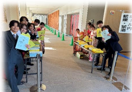
受付(参加者一人ひとりにパンフレットを渡します。)

約30分の式典では、司会、市民憲章の唱和、二十歳の決意を読む。この3つが実行委員の主な仕事です。誰がこの仕事をするかは、実行委員の中で話し合って決めます。受付も実行委員がします。