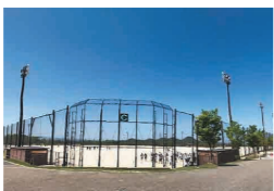
▲草津グリーンスタジアム ▲守山市民運動公園 ▲東近江市総合運動公園

▶競技レベルや年齢、使用球(皮ボール or ゴムボール)による多様なカテゴリーを設定。前半(3日間) or 後半(3日間)だけの出場も OK なので、幅広いチームからのエントリーをお待ちしております！