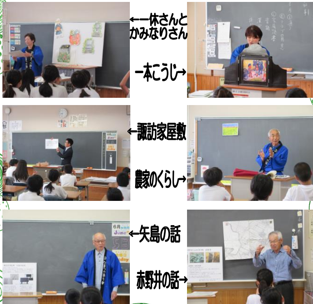
←一休さんとかみなりさん

6月5日(金) 玉津小学校4年生から6年生の子どもたちに「語り部」の活動をされました。