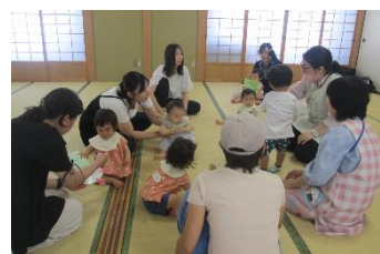
わくわく子育て応援プログラム